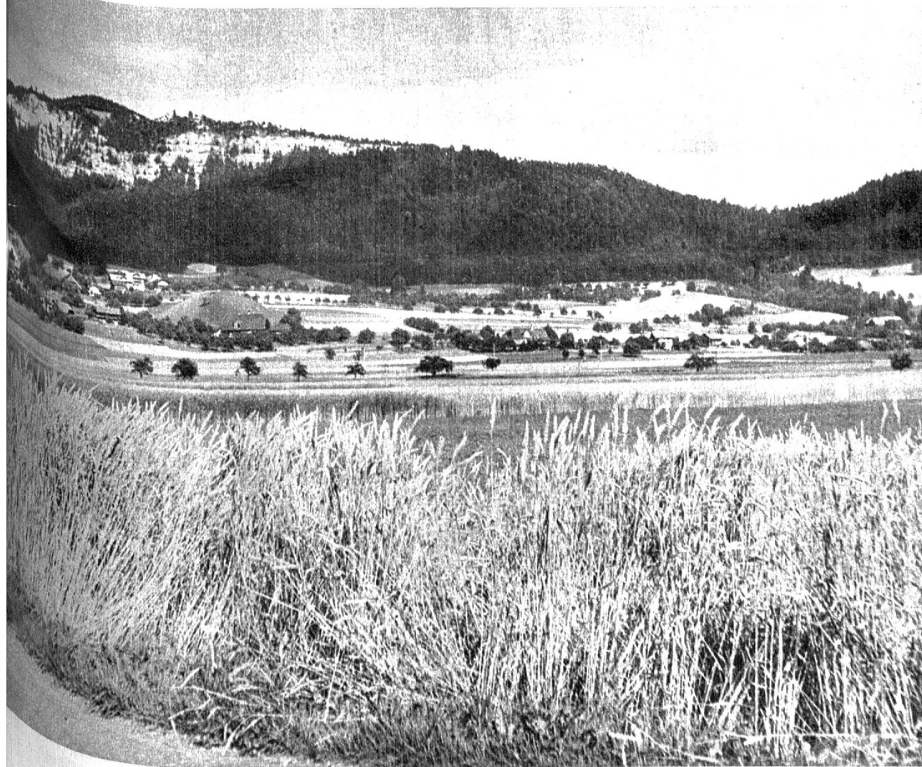
Unterwegs von Burgdorf nach Thun