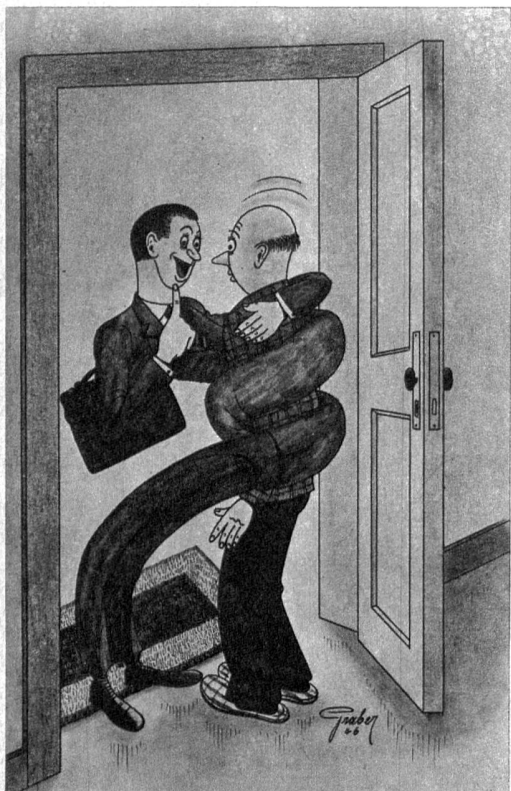
Ein ganz füchtiger Versicherungsagent