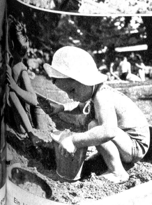
Ein kleines fleissiges Sandmännchen