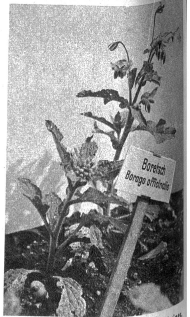
Boretsch, Borago officinalis. Einjähriges, jedoch gern verwilderndes Kraut für die Küche und als Heilmittel, die jungen Blätter dienen als Salatzugabe. Abguss der Blüten für innere Zwecke