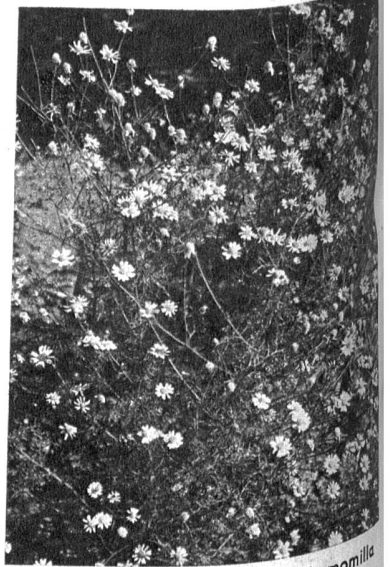
Kamille, echte, Matricaria Chamomilla und römische, Artemis nobilis. Einjähriges, sich selbst versamendes Heilkraut. Kommt auch verwildert an Wegrändern und Schutthaufen vor