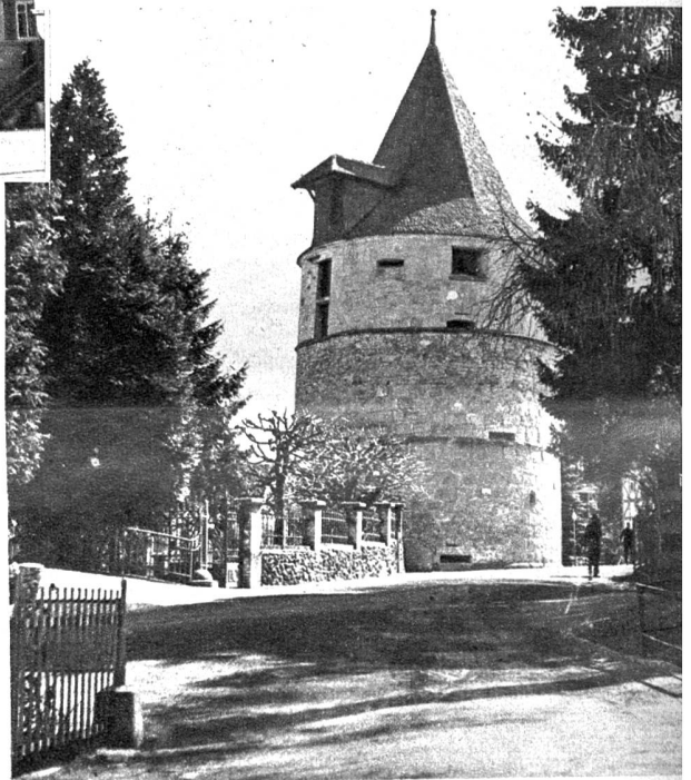
Mitte rechts: Alte Gässchen führen durch malerische Winkel zu Türmen hinauf, die das Städtchen schirmen