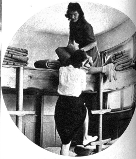
Das Schlafzimmer hat zweigeschossige Pritschen