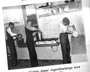
In den Küchen dieser Jugendherberge wird elektrisch gekocht