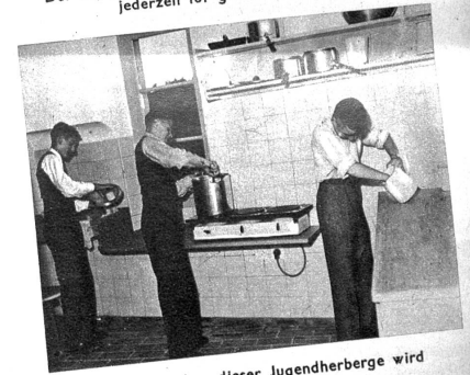
In den Küchen dieser Jugendherberge wird elektrisch gekocht