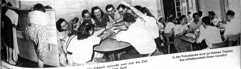
Die schönen Waschräume verlocken zur Sauberkeit