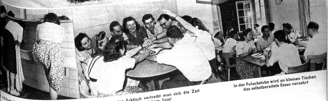
Am runden Eckstisch vertreibt man sich die Zeit mit fröhlichem Spiel