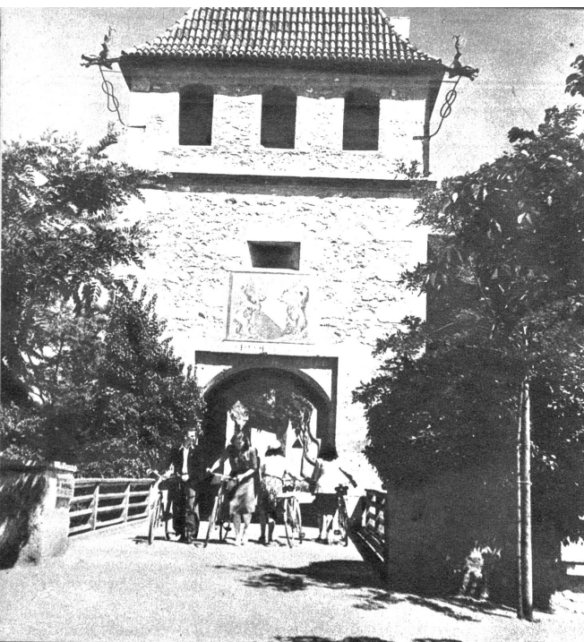
Durch den wieder schön hergerichteten alten Torturm nimmt nun die herbersuchende Jugend von heute ihren Weg