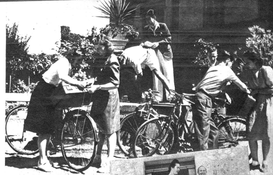
Noch einen Trunk aus dem 1000jährigen Schlossbrunnen, dann geht es weiter von der gastlichen Stätte weg