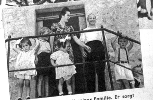
Der Herbergsvater mit seiner Familie. Er sorgt jederzeit für gute Ordnung