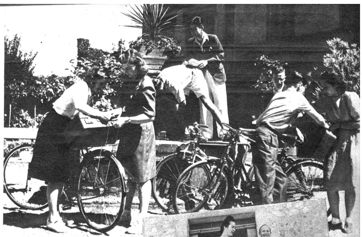
Noch einen Trunk aus dem 1000jährigen Schlossbrunnen, dann geht es weiter von der gastlichen Stätte weg