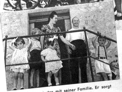
Der Herbergsvater mit seiner Familie. Er sorgt jederzeit für gute Ordnung