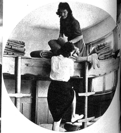
Das Schlafzimmer hat zweigeschossige Pritschen