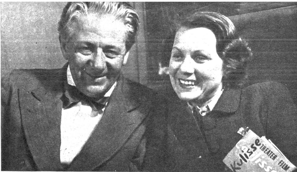
Paul Hörbiger und Grete Heger in Franz Molnar's Lustspiel «Die Fee». Am 6., 7., 8. September wurden im Berner Alhambatheater die Abschiedsvorstellungen gegeben; anschliessend trennten sich die beiden hervorragenden Schauspieler wieder von der Schweiz. Paul Hörbiger folgt einem Engagement in die Vereinigten Staaten, und Grete Heger möchte nach langjährigem Schweizer Aufenthalt Wien, ihre Vaterstadt, wiedersehen.

bis zum Kranz der Berge zurückbrachte. In diesem Land waren die Ströme grösser, breiter, die Städte gewaltiger, erdrückend. Aber für Kate verblassten sie vor dem Bild der Heimat.