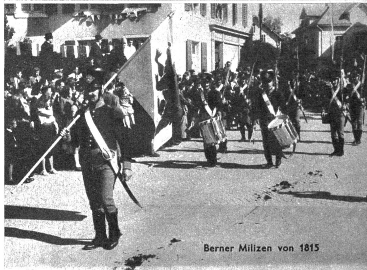
Berner Milizen von 1815