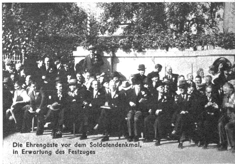
Die Ehrengäste vor dem Soldatendenkmal, in Erwartung des Festzuges