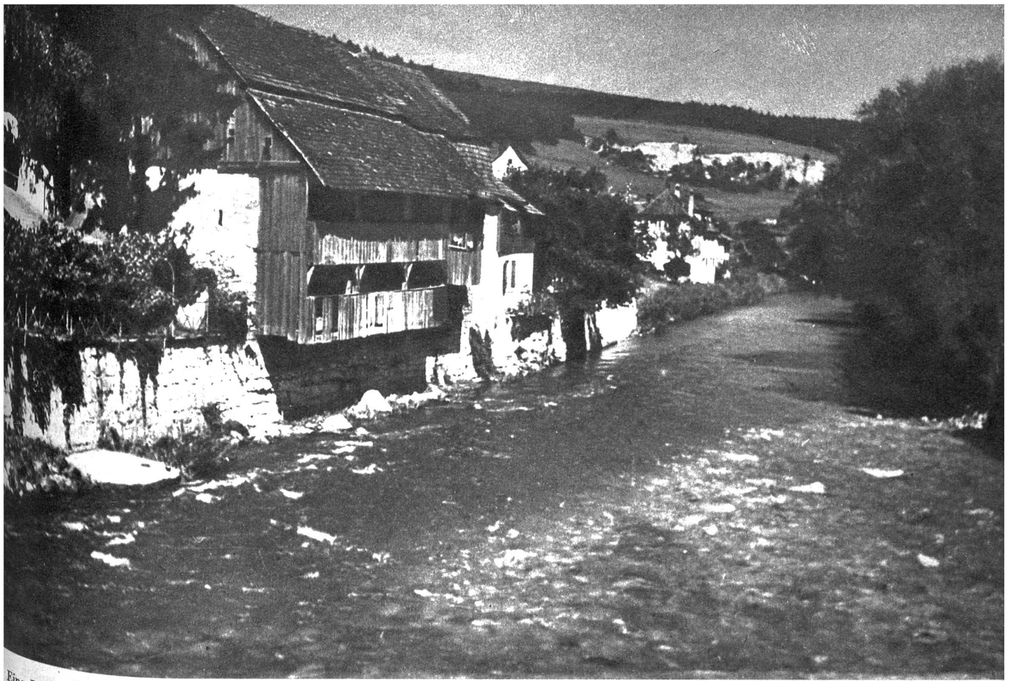
Eine Partie Alt-Laufen gegen die Birs zu

und die Kosten der in den Strafanstalten eingesperrten kriminellen Trunksüchtigen 40 000 Franken. Besagter Kanton muss also für die Folgen des Alkoholismus rund den gleichen Betrag ausgeben, den er aus den Wirtschaftspatenten zieht.