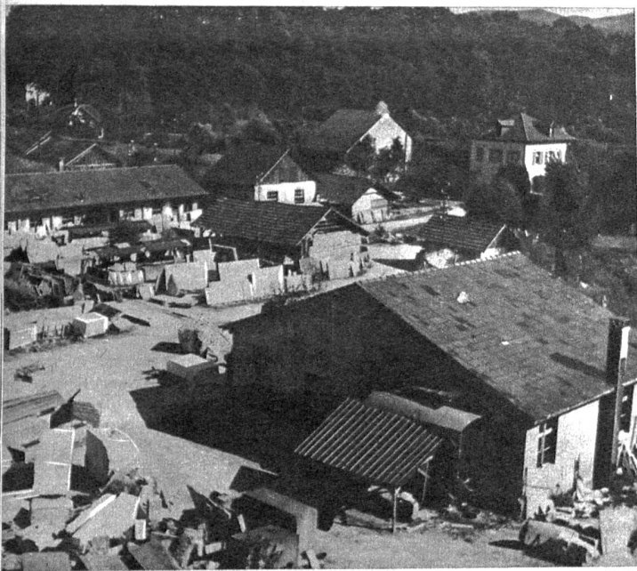
Links: Teilansicht des Unternehmens Cueni & Cie, Laufen