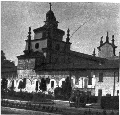
Die Kirche von Musocco beim Endpunkt der Autobahnen in Mailand

Für das weitere Vorgehen haben wir uns nun folgende Ueberlegungen zu machen: Spitalbehandlung oder Hausbehandlung. Bei der Spitalbehandlung haben wir alle Gewähr, dass die Lungenentzündung sachgemäss behandelt