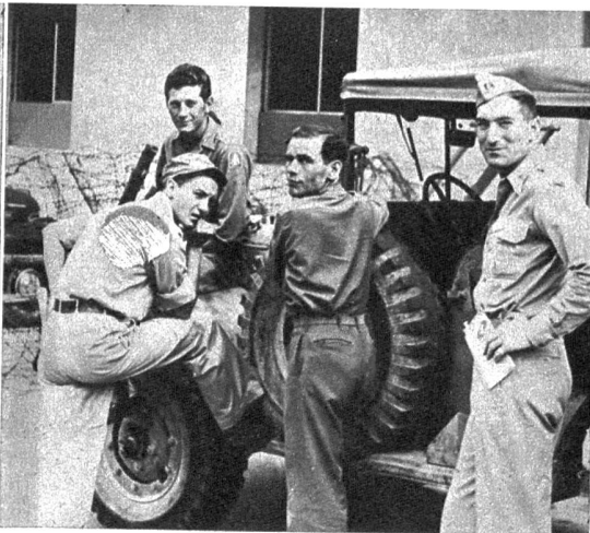
Sehr selten sind in Oberitalien die Amerikaner geworden, die noch vor einem Jahr aus dem italienischen Städtebild nicht wegzudenken waren