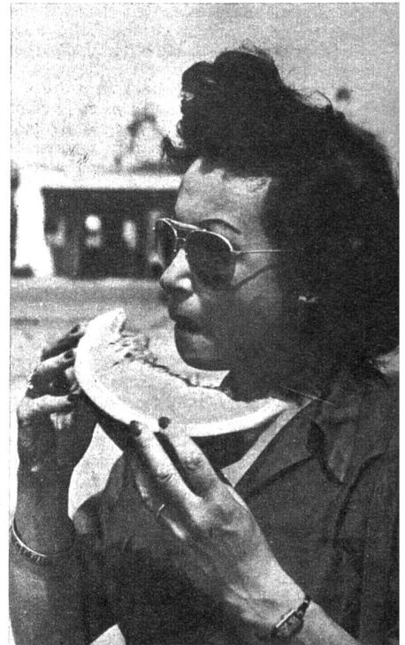
Überall werden auf der Strasse gewaltige Melonenschnitze gegessen — besser gegen den Durst als Wasser und ausserdem sicherer, weil da und dort Typhus herrscht

ist und sich heute nicht leicht zur innern Ruhe findet. Dieses Volk, das noch keine hundert Jahre als einheitliche Nation zusammengefasst worden ist und alle seine Regierungen aus Tradition immer mehr oder weniger mit Misstrauen und über die Schultern anblickte, hat es nicht leicht, über Nacht demokratisch zu werden. Das Gefühl der Solidarität überschreitet auch heute noch den engern Kreis der Sippe oder Klasse kaum, und deshalb ist es nicht verwunderlich, wenn der Klassen-