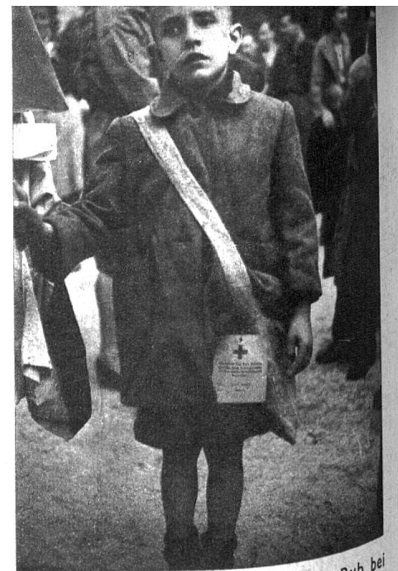
Ein jugoslawischer präüberkulöser Bub bei seiner Ankunft. Jedes Kind war mit einem Kaput, einer Lunchtasche, einem Pyjama, einer Zahnbürste und Zahnpasta ausgerüstet, alles ein Geschenk der Amerikaner (UNRRA)