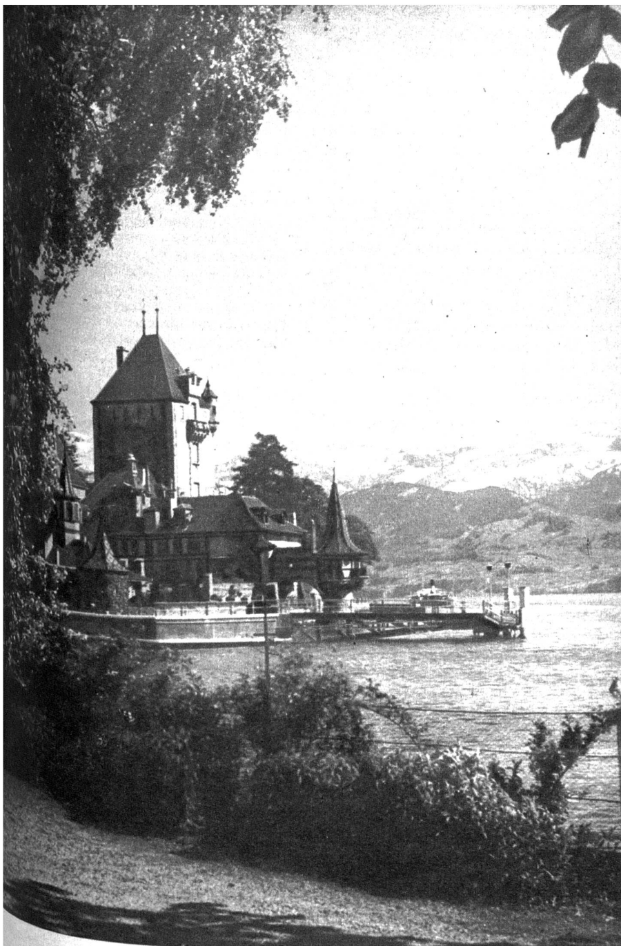
Schloss Oberhofen am Thunersee

Sonne am Jura unterging, fielen goldene Strahlen in ihre hintersten Winkel und machten sie hell und gemütlich. Nachts, bei elektrischem Licht, unterchieden sie sich wenig von den Räumen der unteren Stockwerke, denn die weissen Spitalbetten, von exakten Schwesterhänden gestreckt, gaben dem Baum trotz des Teppichs und den weissen Polsterstühlen unfehlbar das Aussehen eines Krankenzimmers. Dr. Baumann lag in einem unruhigen Halbschlummer und fühlte, dass das Schlafpulver, das er eingenommen hatte, nicht wirkte, wohl aber machte es seine Glieder bleiern schwer. Hinter seinen geschlossenen Lidern zogen viele flüchtige Bilder vorbei. Sie glichen den Bildern eines Films, der sich unaufhörlich abrollt, nur dass er das Kino