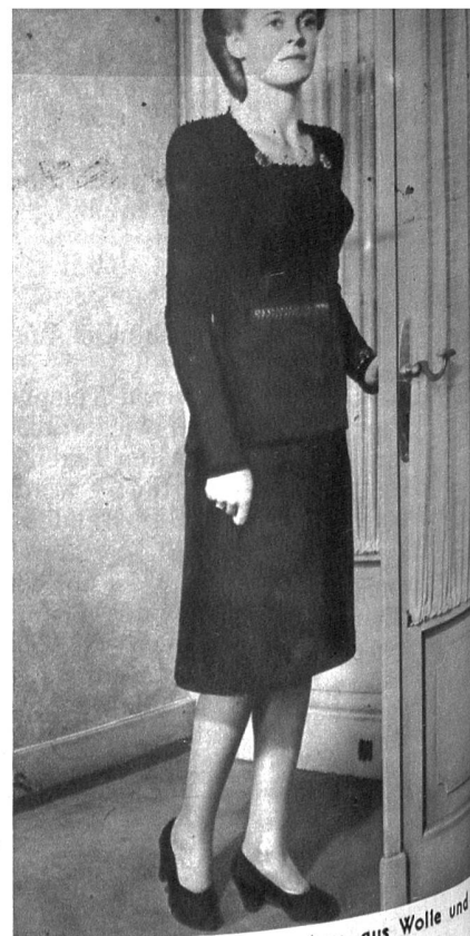
Apartes schwarzes Deux-pièces aus Wolle und Seidenband gestrickt

Dr. Baumann zog tief den Rauch seiner Zigarette ein und ging auf die Suche nach dem Aschenbecher, der ir-