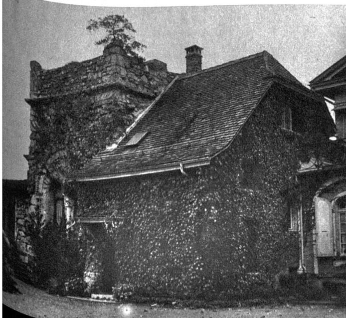
Das Gossetgut in Wabern in seinem heutigen Zustand