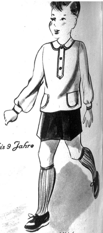
4 bis 9 Jahre

1460 und 1463. Es sieht nett aus, wenn Brüderlein und Schwesterlein gleich gekleidet sind. Wir zeigen hier ein einfaches Kasakblusli, das mit farbigen Tressen verziert ist. Dazu wird ein dunkelblaues Höschen oder ein Faltenjupe getragen