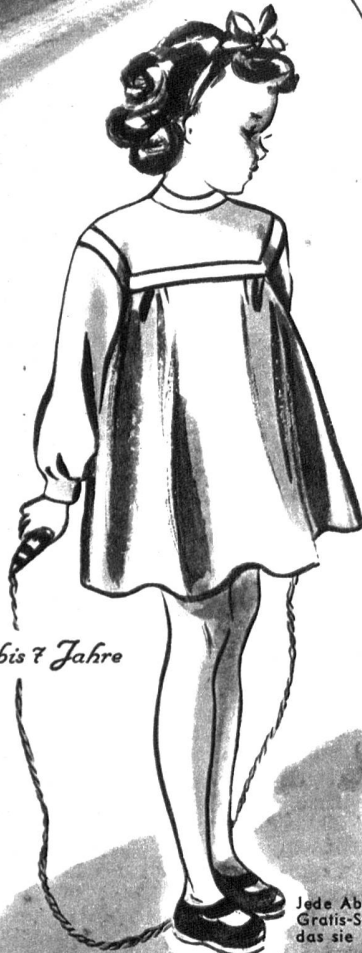
3 bis 7 Jahre

1462. Das Kleid der grossen Schwester ist im Oberteil gleich gearbeitet, doch das Jupe weist zwei bequeme Taschen auf und wird von einem sportlichen Ledergürtel zusammengehalten