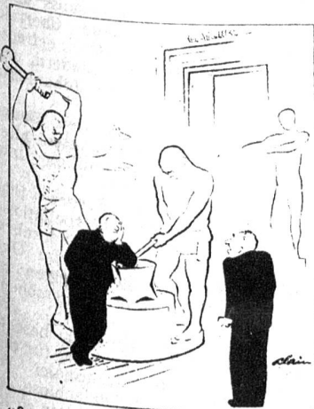
«Sag mal, Smith, könntest du nicht wo anders anlehnen? Mich macht das so nervös...» («The New Yorker»)