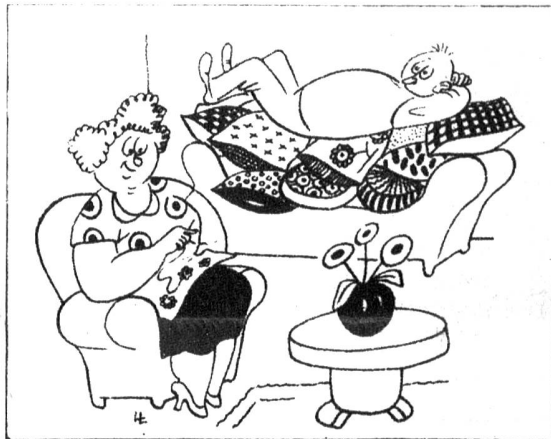
Ausdauer: «Was nächst du eigentlich?» — «Ich bin dabei, ein Sofakissen zu nähern.» (Söndagsnisse-Strix)