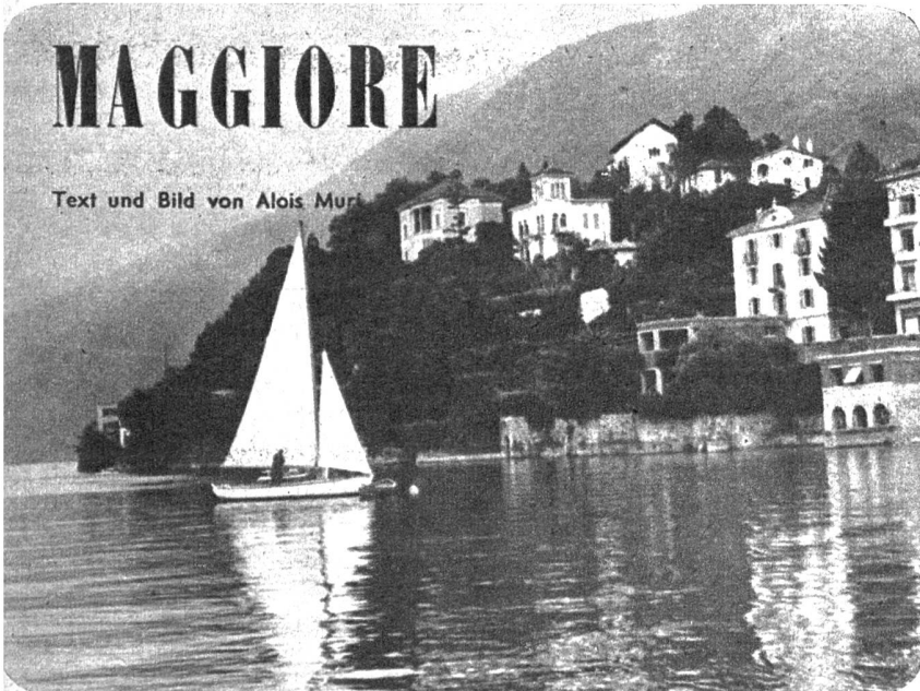
Segler durchkreuzen das Wasser, vorbei an den mit viel Baumgrün und prachtvollen Villen umsäumten Ufern des Lago