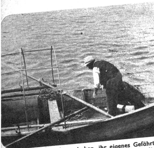
Die Tessiner Seen haben ihr eigenes Gefährt: Die Fischerbarke. Ein besonderes Gestell ist für die Blache bestimmt, die vor Regen und allzu heisser Sonne schützen soll