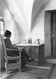
Im bündnerischen Vorraum