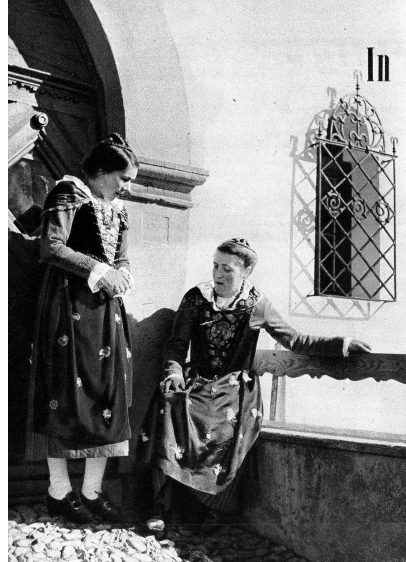
...schelchen vor dem Haus