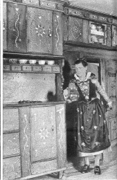
Überall sehen wir schöne kleine Kästchen mit eingelegetem Holzmuster