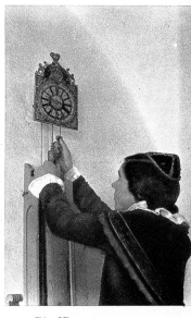
Die Uhr wird aufgezogen