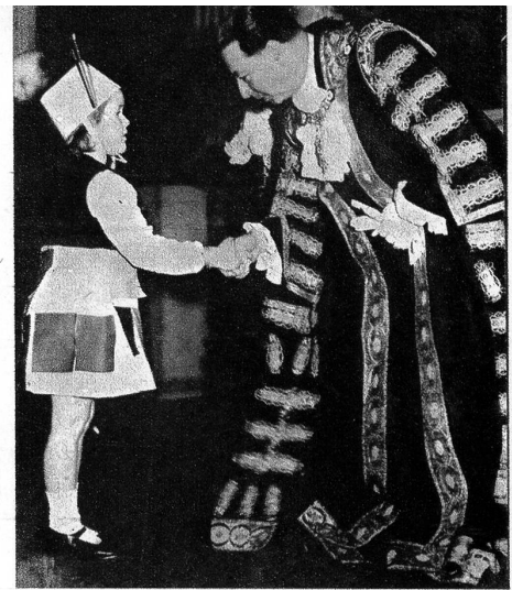
Der Lord-Major von London, Bracewell Smith, organisierte am 4. Januar einen Empfang für 1200 Kinder im Mansion House. Wie gemeldet wird, reichte der Lord-Major jedem kleinen Gast die Hand. Dem Empfang wohnte auch Premierminister Attlee bei