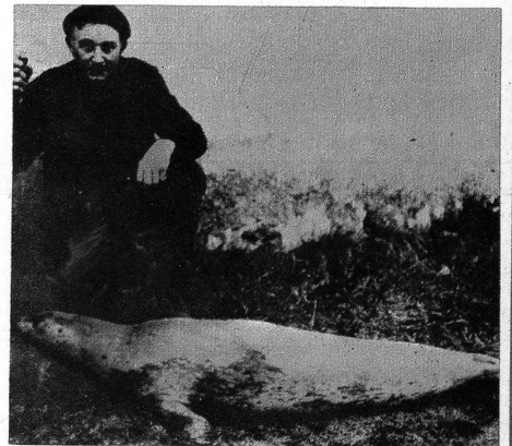
Einen seltenen Fang machte dieser Tage ein Landwirt in der Nähe von Bordeaux. Er sah in der Gironde einen Seehund schwimmen, der sonst nur in den Gewässern des hohen Nordens anzutreffen ist. Der Mann ergriff eine Flinte und konnte das Tier, das eine Länge von 1,5 m hatte,