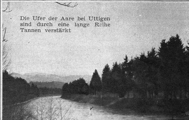
Die Ufer der Aare bei Uttigen sind durch eine lange Reihe Tannen verstärkt

liche Schritte... Er stürzte ins Freie und eilte der fliehenden Gestalt nach.