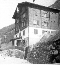
Das im Jahre 1937 erbaute Zollhaus Binn im Goms, wo mehrere Passübergänge aus Italien einmünden