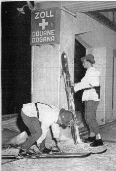
Grenzwachter auf Spligen-Passhöhe rüsten sich zur Patrouille