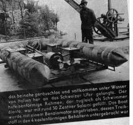
das belinde geräuschlos und vollkommen unter Wasser von Italien hier an das Schweizer Ufer gelangte. Der von Italien hier an das Schweizer Ufer gelangte, der zugleich als Schwimmtüfelentformige Schwimm- der zugleich als Schwimmtüfelentformige Schwimm- der zugleich als Schwimmtüfelentformige Schwimm- wurde mit einem Benzinmotor angetrieben, dessen Treibstoff in den 4 kastenförmigen Behältern untergebracht war.