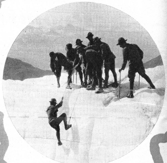
Grenzwachter im Planfondrietal an einem Geirler Grenzbergang