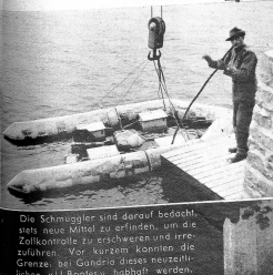
Die Schmuggler sind darauf bedacht, diese neue Mühl zu erfinden, um die Zollkontrolle zu erschweren und irrezuführen. Vor kurzem konnten sie Grenze bei Gomsio dieses neuzeitlichen «Luganser» habhaft werden.