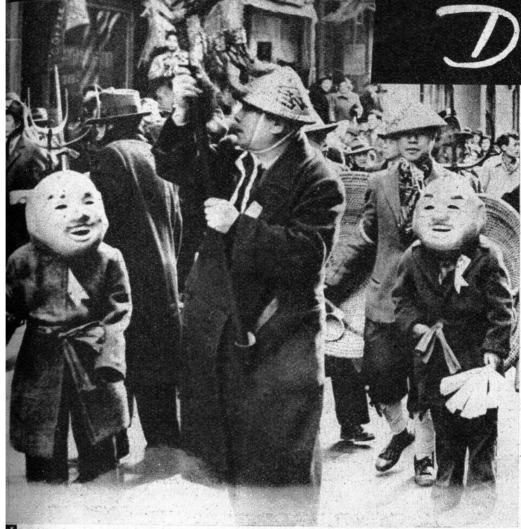
Am 28. Januar feierten die Chinesen ihr Neujahrsfest 4644. Mit grossem Tam-Tam wurde auch im Chinesenviertel von Neuyork gefestet, wo mehrere grosse Umzüge durch die Strassen zogen. Unser Bild zeigt einen Ausschnitt aus der Schlangen-Prozession

hältnissen. Ueber die umfangreichsten Ländereien kann sich unzweifelhaft die «Forestry Commission» ausweisen; ihr gehören nicht weniger als 400 000 Hektaren Wald. Die einzelnen Grafschaften Englands verwalten zusammengenommen etwa 200 000 Hektaren, ungefähr im gleichen Grössenverhältnis bewegen sich auch die Krondomänen, während die Kirche sowie die Wehrministerien und Universitäten auf einen Besitz von je 130 000 Hektaren Boden Anspruch erheben können.