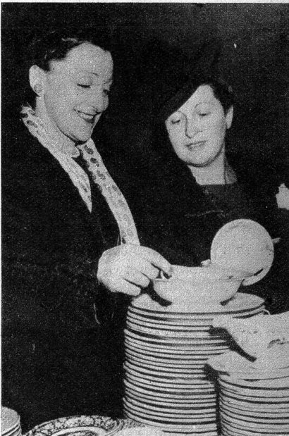
Am Grosvenor-Square in London befindet sich bis heute die allerdings geschlossene Gesandtschaft des Reiches der aufgehenden Sonne. Nun hat aber die englische Regierung beschlossen, das Mobiliar der Gesandtschaft auf einer öffentlichen Auktion in Henley's Hall zum Verkauf freizugeben und den Erlös dem Reparationskonto gutzuschreiben. 1100 Einzelstücke wurden vergantet. Begreiflicherweise fand das kostbare Geschirr das besondere Interesse der Londoner Damenwelt! (ATP)