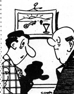
«Streitet ihr euch nie, du und deine Frau?» — «Nein!» — «Komisch, wie kommt das?» — «Ich habe keine Frau...»