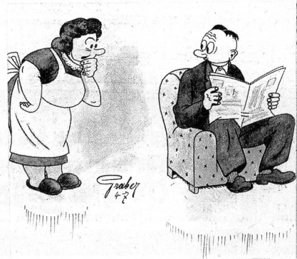
«Hesch au e Wunsch zum Geburtstag, Heiri?» — «Jo, allerdings — aber der Friedensrichter het gseit, i müess e triftige Grund chönne gä.»