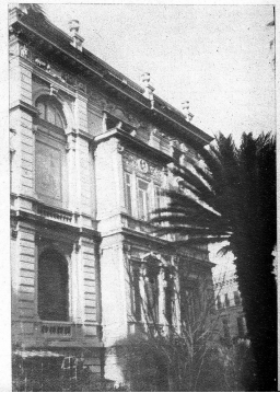
Rechts: Teil der imposanten Fassade