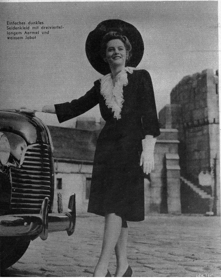
Einfaches dunkles Seidenkleid mit dreiviertel-langen Ärmeln und weißem Jabot