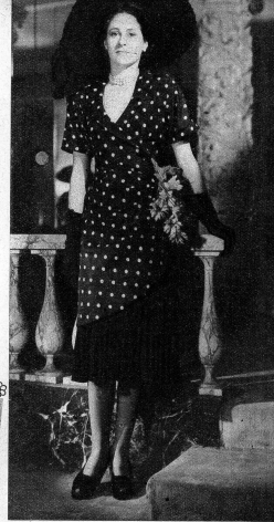
Nachmittagskleid aus schwarzem Pisse- jupe und Tunique aus schwarzem Taffet mit weißen Tupfen. Weiße und gelbe Margeriten als Abschluss