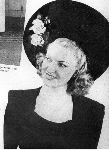
Grosser aufgeschlagener Feltz mit Rosengarnitur

Viel Blumen und Spitzen finden Verwendung und gehen der neuen Mode einen luxuriösen Aspekt. Wenn diese in ihren extremen Tendenzen, sie erinnert vielfach an Modelle aus den Jahren 1900, auch nicht durchwegs unsern ungeteilten Beifall finden mag, so wird sie doch mit der Betonung der weichern und fraulicheren Linie vielfach Beifall finden. hr.