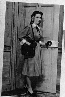
Schwarz-weiß kariertes Wollkleidchen mit weißer Piquegarnitur, schwarzer Krawatte und ebensolchem Gürtel

Die Pariser Modeschöpfer haben für den kommenden Frühling, der dies Jahr besonders lange auf sich warten lässt, eine Fülle neuer Ideen gezeigt, die erstmals wieder die intensive Schaffenskraft dieser Metropole auf dem Gebiet der Mode erkennen lassen. In der Überzeugung, dass die Welt genug hat von Uniformen und rein auf Praktische abgestimmten Kleidern haben die Modehäuser reizende, sehr weiche und frauenhafte Modelle herausgegeben, die den weiblichen Charme ganz besonders hervorheben. Die neuen Farben vor allem sind wunderschöne in jeder Nuance vorhandene Pastell-töne, die durch geschickte Kombination ganz besondere Effekte erzielen. Die Achseln haben ihre starre gerade Breite entgelbt und schmiegen sich wieder schön