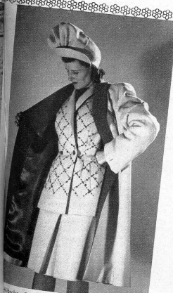
Reines Ensemble aus weißer Wolle mit roter Garnitur und rotem Futter