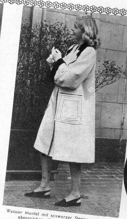
Weisser Mantel mit schwarzer Steppgarnitur und ebensolchem Kragen und Manschetten