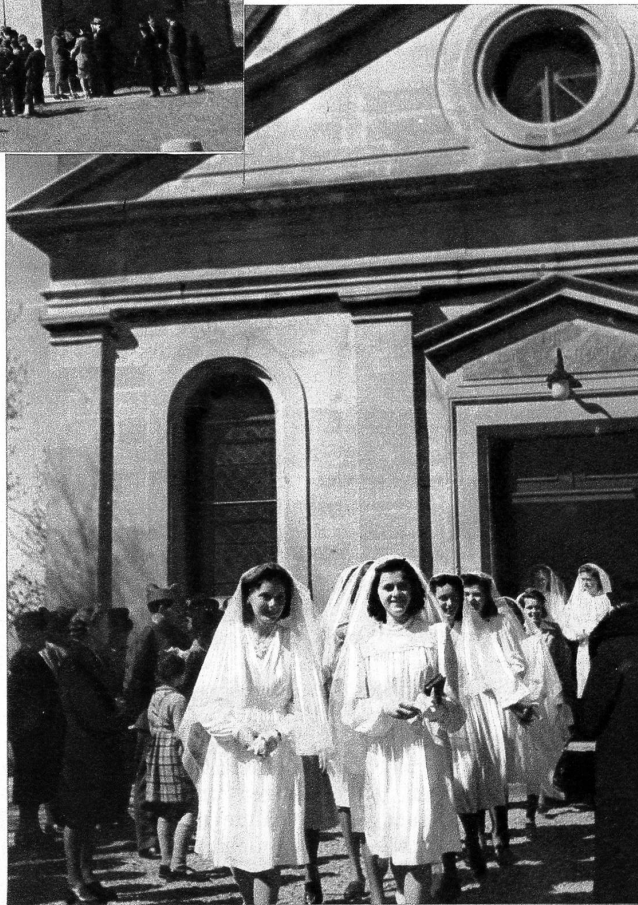
Links: Der Herr Pfarrer im Gespräch mit zwei Konfirmandinnen. — Rechts: Nach der Konfirmation: Die Konfirmandinnen verlassen die Kirche

An der Strasse nach Echallens, tief im Waadtland, liegt das Dörfchen Prilly. Am Palmsonntag und Ostersonntag sieht man hier junge Mädchen mit weissem Schleier und meistens weissen Kleidern, die ihnen ein wenig den Ausdruck trauernder Bräute geben, zur Kirche gehen. Heute ist ihr Konfirmationstag; es ist ihr grosser Tag, denn sie werden gefeiert und auch beschenkt. In ihren neuen Kleidern und mit den weissen Schleiern gehen sie, mit einer leichten Unbeholfenheit, ins Gotteshaus. Wie ein Senkblei legt der