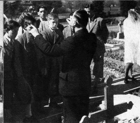
Gesang zu Ehren der jungen Verstorbenen