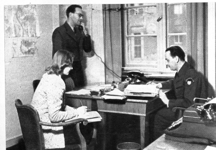
In einem Zimmer des «Duisburger-Hof», dem grössten Hotel in Duisburg, hat die «Swiss Rhine Mission» ihr Hauptbureau, das ziemlich bescheiden aussieht, eingerichtet. Während die alliierten Delegationen mit einem riesigen Stab von Mitarbeitern tätig sind, beschränken die Schweizer ihre anstrengende Arbeit mit nur drei Leuten.