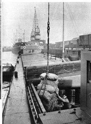
Nach langer Pause herrscht nun wieder eine freudige Betriebsamkeit um die schweizerischen Rheinschiffe, gelangt doch der grösste Teil unserer Importe auf dem Rhein zu uns. Ganze Eisenbahnzüge von Gütern verschwinden im riesigen Busch «unserer» Schiffe, die unter der Wachsamkeit der dienstfertigen «Swiss Rhine Mission» zu uns gelangen.

wollen wissen, wo ihre Schiffe stecken geblieben sind und ob solche eventuell auf Grund gelaufen sind. Dann stellen sich wieder die Fragen, ob die Ware für den Weitertransport auf kleinere, weniger tief gehende Schiffe umgeladen werden kann oder aber ganz ausgeladen werden muss. Und so gibt es oft von einem Tag auf den anderen, neue, schwierige Probleme zu lösen. Kapitän muss angeordnet werden, dass sie sich in diesen oder jenen Winterhafen zurückziehen sollen, um den Gefahren des treibenden Eises zu entgehen. Laufend kommen andere Schwierigkeiten, die von den paar Leuten in kurzer Zeit bewältigt werden müssen, soll die schweizerische Rheinschifffahrt ungehindert funktionieren. Der grösste Teil der Arbeit, die oft bis in die Nacht hinein dauert, besteht indes im Telefonieren. Aber gerade hier liegt die grosse Tücke. Wir können uns kaum einen Begriff machen, welche Komplikationen die Verbindungen herbeiführen, besonders wenn sie in eine andere Besetzungzone oder gar nach der Schweiz gehen sollten. Da heisst es in der Regel stundenlang warten, bis der gewünschte An-