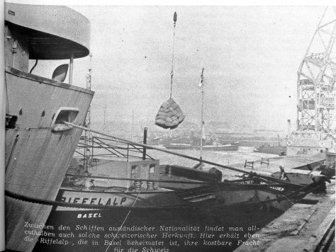
Zwischen den Schiffen ausländischer Nationalität findet man allenthalben auch solche schweizerischer Herkunft. Hier erhält eben die «Riffelp» die in Basel beheimatet ist, ihre kostbare Fracht für die Schweiz.

Materie gut vertraut sind. Der Hauptsitz der «Swiss Rhine Mission» befindet sich in Duisburg, wo auch die verschiedenen alliierten Delegationen, mit denen stets ein enger Kontakt besteht, ihr Hauptquartier aufgeschlagen haben. Zweigstellen befinden sich ausserdem in Köln und Wiesbaden. Früher hatten die verschiedenen Schweizer-Reedereien ihre eigenen Vertreter im Rheinland. Heute vertritt die «Swiss Rhine Mission», als einzige zugelassene Schweizervertretung im besetzten Gebiet, die Interessen aller Reedereien unseres Landes, so dass sich diese wenden können. Wie uns Herr Locher, der Chef der S.R.M. mitteilte, besteht ihre Arbeit, wie bereits erwähnt, nicht nur in der Überwachung der Kohlentransporte, sondern in der ganzen, die Schweiz betreffenden Rheinschifffahrt im besetzten Gebiet. Durch den katastrophalen Wasserstand, die Eisgefahr und dann wieder das Hochwasser wuchs in den letzten Wochen die an und für sich schon komplizierte Arbeit ins Ungeheure. Die Reedereien in der Schweiz