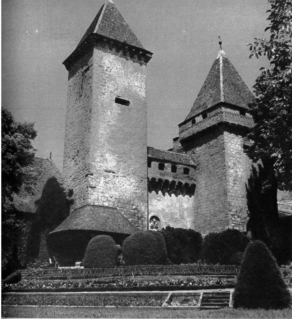
Schloss La Sarraz, eine der schönsten Bauten der Feudalzeit in der welschen Schweiz, steht mit dem wuchtigen Rechteck seines Baues und seinen beiden schönen quadratischen Türmen auf dem höchsten Punkt des Felsplateaus, auf dem die Stadt steht.