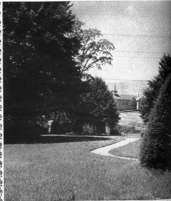
Schlosspark mit Kirche im Hintergrund