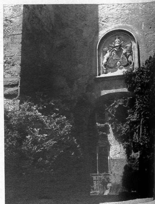
Eingang zum Schloss mit dem Wappen der von Gingins