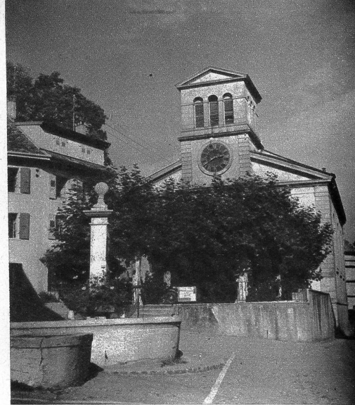
Schlosskapelle von La Sarraz