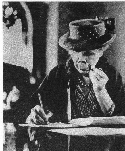
Auch für die alte Dame sind die fahrenden Bibliotheken eine gute Sache, hat sie doch ein Buch gefunden, das ihr ganzes Interesse in Anspruch nimmt