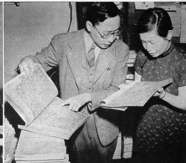
Bücher aus der ganzen Welt kann man in diesen fahrenden Bibliotheken finden, und auf dem Bilde sieht man ein chinesisches Ehepaar beim Betrachten von alten chinesischen Büchern