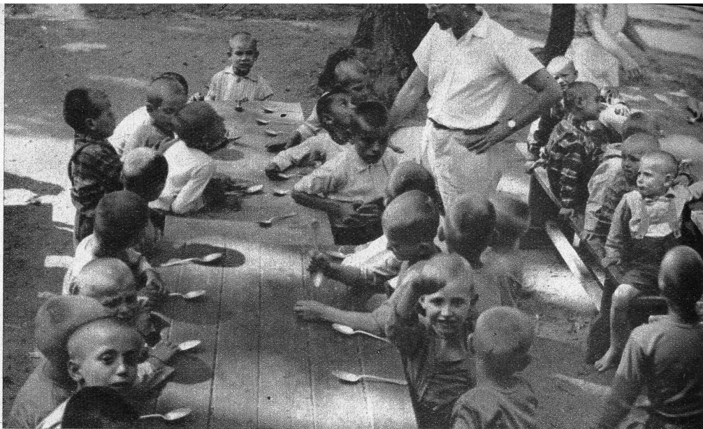
Während der warmen Jahreszeit wird draussen gegessen. Dass die vielen kleinen Schützlinge alle Tage etwas in den Teller bekommen, dafür sorgt unter anderem die Schweizer Spende mit ihren Lieferungen

So waren die Verhältnisse, als das Schweizerische Rote Kreuz, Kinderhilfe, und die Schweizer Spende ihre Tätigkeit in Ungarn aufnahmen.