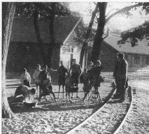
Auf einem alten Artillerieschiessplatz in dem Dörfchen Hajduhadház ist eine Kinderstadt errichtet worden. 200 Jucharten Land stehen hier den Zöglingen zur Verfügung, um sich zu tummeln, den Boden zu bebauen, bei der Landwirtschaft und bei der Geflügelzucht mitzuhelfen, zu basteln und Schule zu haben.

Sieben Kinderheime übernimmt das Schweizerische Rote Kreuz (Kinderhilfe), in Zusammenhang mit der Schweizer Spende. 800 Kinder finden so Aufnahme und Pflege. Zwar hätten noch viel mehr Kinder der Hilfe nötig. Welch unermessliches Leid, wie manch trauriges Schicksal begegnet den Schwestern, die damit betraut sind, unter den hungernden Kindern die hungrigsten, unter den darbenenden die darbensten auszuwählen. Es sind zumeist elternlos, gänzlich verlassene Kinder, die oft die Deportation der Eltern erlebt oder in Lagern