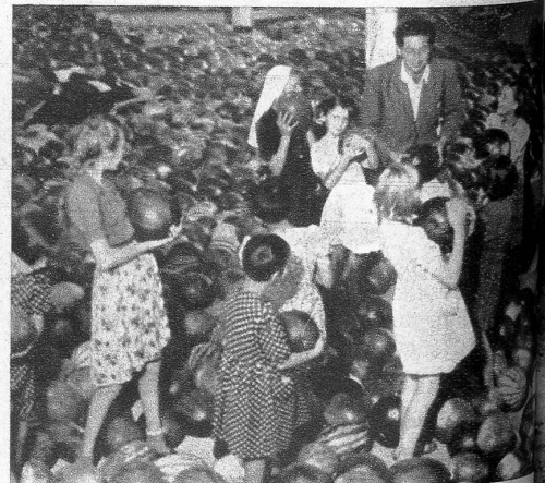
Melonenernte in der Kinderstadt! Es bereitet den Kindern viel Spass, sich mit den grossen, goldenen «Gummiballen» herumzubalgen