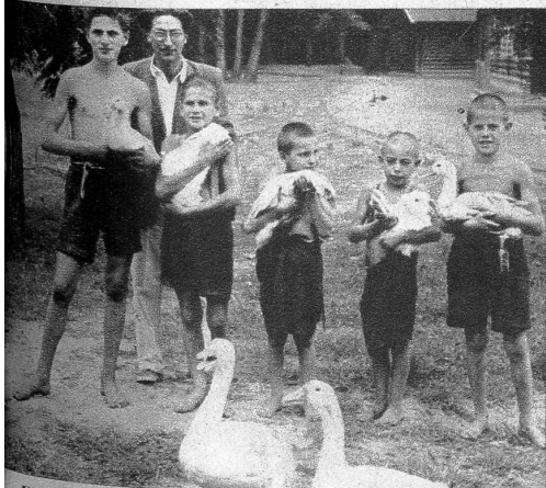
Die Gänsezucht spielt heute in Ungarn wegen des stark eingeschränkten Viehbestandes eine grosse Rolle. Auch in der Kinderstadt weiss man die kleinen Fettspender zu schätzen

allen Seiten gebracht. Zitternd vor Kälte und Schwäche stehen diese Kleinen vor uns, und wir bringen den Mut nicht auf, sie wegzuweisen. Wie viel Tapferkeit lernen wir bei Kriegswitwen und Frauen von Kriegsgefangenen kennen. Unentwegt kämpfen und arbeiten sie, um eine Kleinigkeit zu verdienen, denn die staatliche Unterstützung genügt bei weitem nicht, um die Not fernzuhalten. Welch eine Erlösung von drückender Sorge, wenn