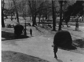
Die Promenade des Bastions mit den strengblickenden Standbildern der Reformatoren ist die Anlage für ältere Jahrgänge und für Kindermädchen mit Wogen samt Inhalt.