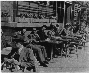
LA POTINIERE im Jardin anglais ist eines der bekanntesten Parc-Cafés in Genf und beim warmen Frühlingssonnenschein kann man hier selbst vom Völkerbund verschönlich träumen.