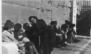
Unten: Auf der Promenade de la Trelle sonnen sich die älteren Damen des Quartiers, in dessen Gassen die Sonne nur bescheiden scheint. Hier oben ist man vor der Bise geschützt.