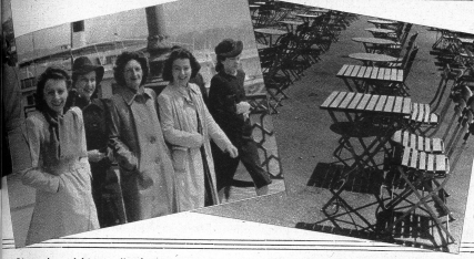
Bis oder nicht — die Jungmannschaft macht ihren Verdauungspaziergang bei jedem Wetter — und überdies hat man nicht jeden Tag Geld fürs Café.