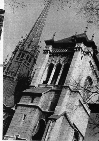
Rechts: Über allen Promenaden und Parks und Boulevards steht die Kathedrale.