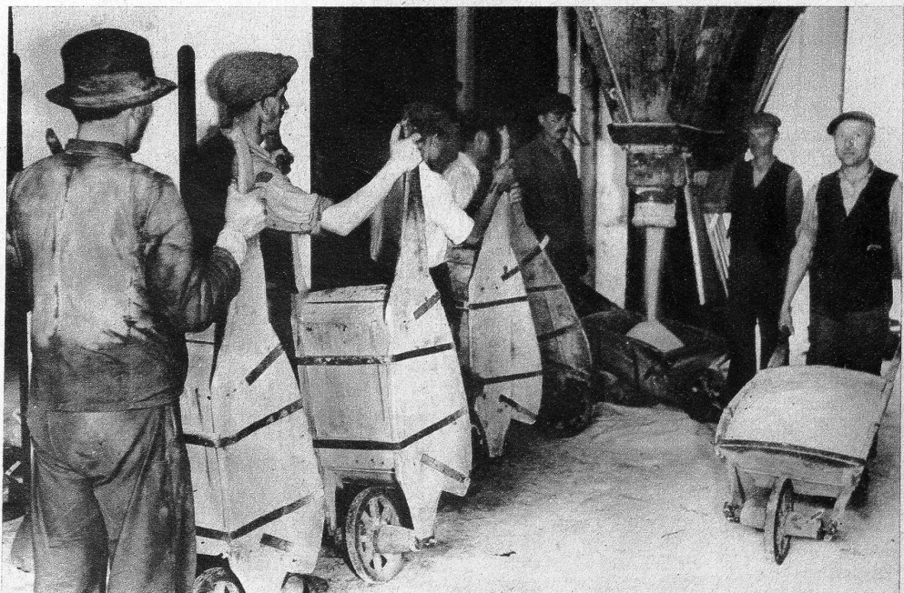
Vermag das Förderband nicht alle Arbeit zu leisten, so wird feingemahltes Steinsalz auch im Schubkarren gefasst und zur Verschiffung gerollt — Links: In der Salzkapelle: Steinsalzfiguren, darstellend die heilige Kunigunde und den heiligen Antonius