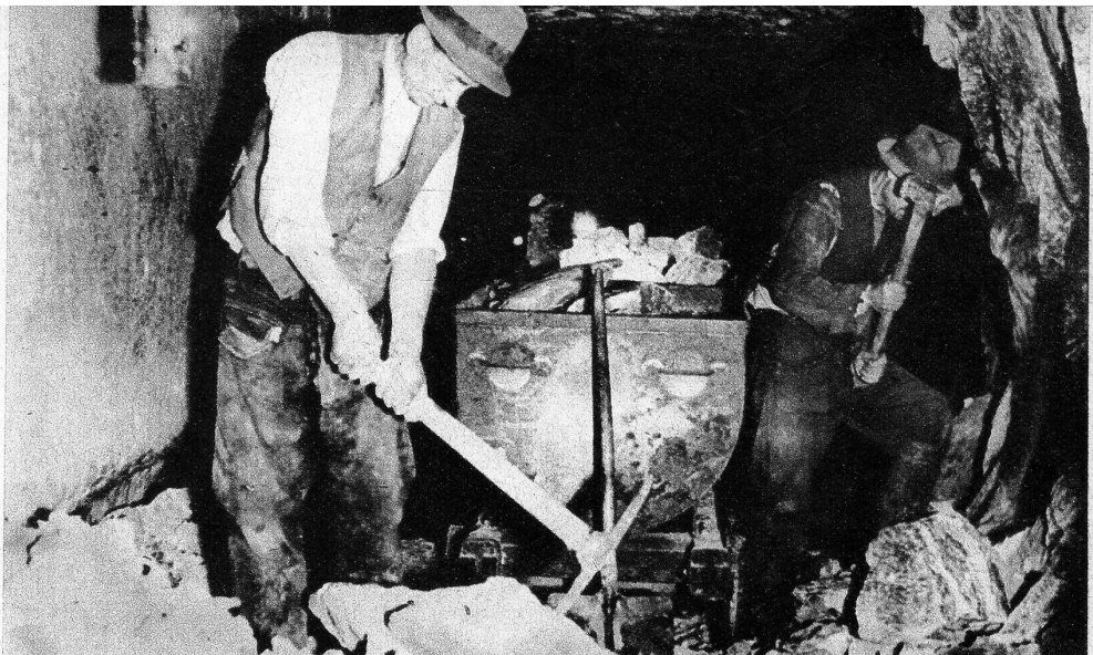
Das ausgesprengte Steinsalz wird im Stollen mit der Spitzhacke zerkleinert und in die Grubenhunde verladen