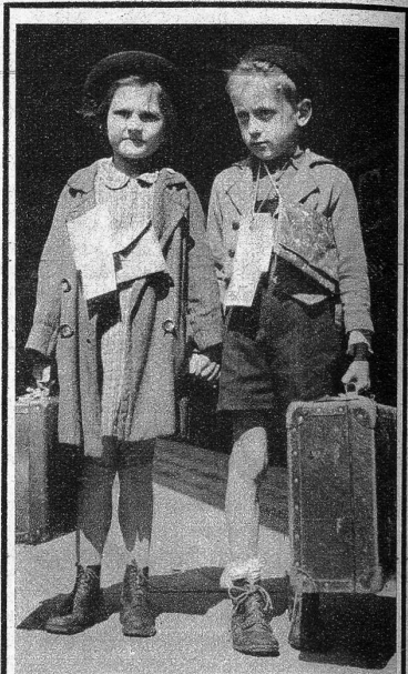
Für drei Monate dem Elend entronnen!

Das Berner Heimatschutztheater hat mit der Aufführung dieses Dreiakters bewiesen, welche grosse dramatische Gestaltungskraft im Heimatschutztheater liegt und die darstellenden Kräfte waren so echt und lebensnah, dass sie die zahlreichen Zuhörer ständig in Spannung hielten und der gestalteten Idee zu nachhaltiger Wirkung verhalfen. hkr.