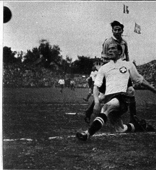
Hier sehen wir Gyger, bei einer Abwehr auf der 5-Meter-Linie vor dem Linksverbinder Hagan (ATP)

Erfolg eines Schweizer Sportlers im Ausland: Der bekannte Berner Sportler Bernhard Frey, der letztes Jahr akademischer Schweizermeister im Hürdenlauf wurde und gegenwärtig an der Universität von Birmingham studiert, erzielte an den englischen akademischen Meisterschaften in Motspur Park (Surrey) einen schönen Erfolg, indem er das 440-Yards-Hürdenrennen gewann. Hier sehen wir unsern erfolgreichen Landsmann im Vordergrund an den Meisterschaften in Motspur Park. ATP