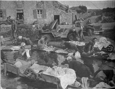
Doch das Leben geht weiter! Irgendwo in der Normandie herrscht grosse Wäsche am Dorfbach. Während die amerikanischen Soldaten bei der Durchfahrt einen Halt machen, schauen sie interessiert dem Treiben zu.