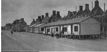
Mitte links: Auf der ganzen Welt scheint Wohnungsnot zu herrschen und natürlich am meisten in den verwüsteten Gebieten. Zwischen Trümmern und Ruinen wurden für die Obdachlosen Baracken erstellt.