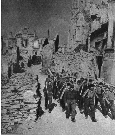
Oben links: Das war einmal eine schöne Stadt; die Normandie war ein herrlicher Flecken Erde - heute müssen deutsche Kriegsgefangene die Trümmer wegräumen.