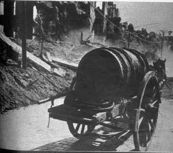
Ein Fuhrwerk rattert durch die Strassen, die links und rechts von Ruinen umgeben sind.