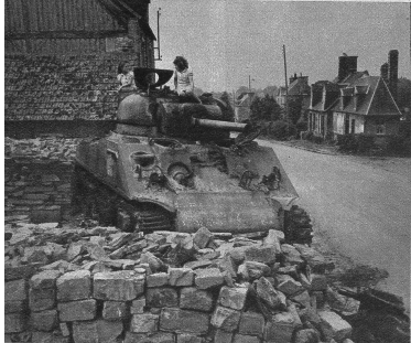
Ein Zeuge einer grossen Schlacht steht verlassen am Strassenrand - doch die Kinder wissen schon etwas damit anzufangen - Vernichtung und blühendes Leben in Eintracht.