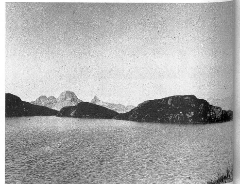
Der Milchspülersee südlich der Leglerhütte. Im Hintergrund (von links nach rechts) Ortstock, Hoher Turm und Faulen.