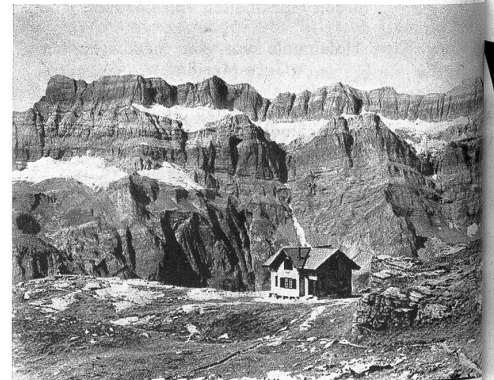
Leglerhütte (SAC) 2277 m inmitten des Glarner Freiberges. Im Hintergrund die Glärnisch-Südseite.

«Es geht nicht gut, wegen der Leute im Büro», erklärte sie ihm. «Ausserdem hätte ich nicht einmal Geld, um mir irgend etwas zu kaufen. Es ist mir auch unangenehm, meinen Schmerz so wie ein Aushängeschild