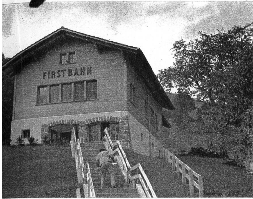
Der hübsche «Hauptbahnhof» in Holzkonstruktion fügt sich gut ins Landschaftsbild