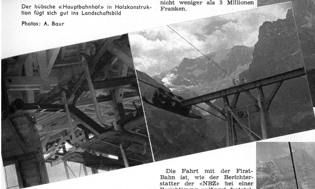
Blick in die «Weichenanlagen» in einer der Zwischenstationen. Auf den Hängeschienen werden die Sessel von einer Sektion der Bahn zur andern geschoben

Die Masten und Rollen erinnern an die Materialtransportbahnen, aus denen die Sesselbahnen entwickelt worden sind