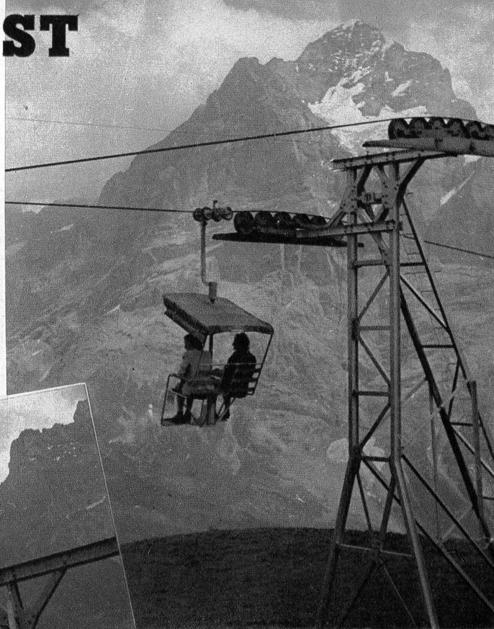
Die Einfahrt in die Endstation auf First

Das Zeitalter der Standseilbahnen ist offenbar vorüber, seit vielen Jahren ist keine solche mehr gebaut worden, dafür überziehen die Sesselbahnen wie Spinnfäden die Berghänge. Den binnen weniger als zwei Jahren eröffneten Bahnen von Flims, Gstaad, Beatenberg hat sich die im Februar 1947 in Betrieb gesetzte Sesselbahn Grindelwald-First angeschlossen. Sie ist ebenfalls nach dem bewährten Patent der von Roll'schen Eisenwerke hergestellt, aber mit einer Länge von 4354 Metern und fünf «Bahnhöfen» ist sie die umfangreichste Anlage dieser Art. Sie kostet auch nicht weniger als 3 Millionen Franken.