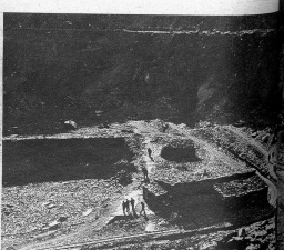
Nach den Sprengungen: die Arbeiter kehren an ihre Arbeitsstätten zurück