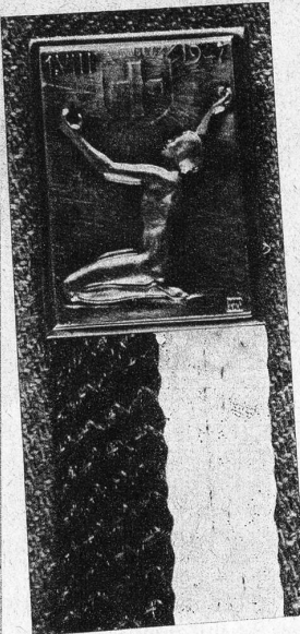
Die 1. August-Plakette 1947

Bekanntlich haben auch gekrönte Häupter meistens sehr ungewöhnliche Steckenpferde. Nun, der junge ägyptische Prinz Seni Toussoun, der zurzeit in Wengen in den Ferien weilt, hat sich für ein sehr demokratisches Steckenpferd entschieden: es ist vorderhand sein grösstes Vergnügen, dem Hotelportier das Gepäckzweirad an die Bahn schieben zu dürfen. Mit zunehmendem Alter wird er sich wohl ein standesgemässeres «hobby» suchen müssen