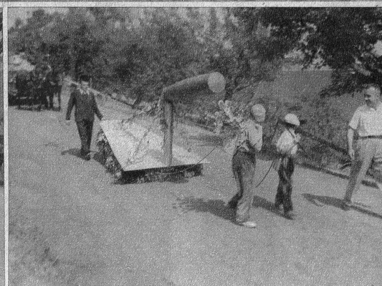
«Handwerk hat goldenen Boden». Links: Zimmerleute. Rechts: Die Maurerkelle