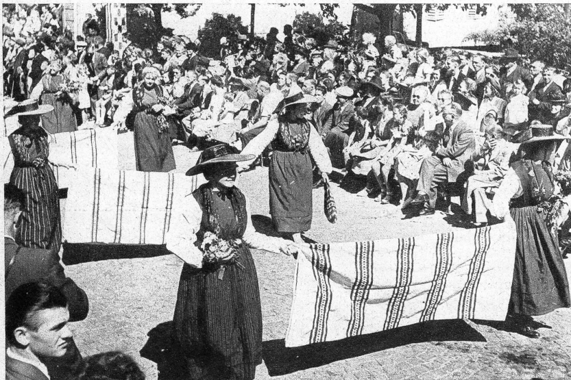
Am Nachmittag bewegte sich ein farbenfroher Festzug durch die fahnen- geschmückten Strassen Langenthals. Das Bild zeigt eine Gruppe Weberinnen aus Oberhasli