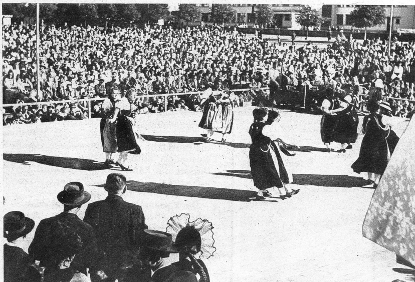
Die Trachtengruppe Lenk tanzt einen «Fyrabewalzer»

Wo könnte sich das Bekanntnis zum Le- ben, zur Freude und zur Heimat besser offenbaren als im Volkstanz?