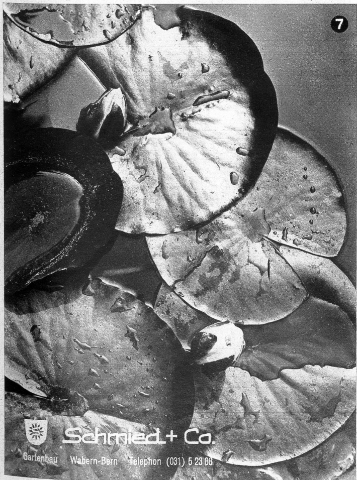
FOTO-KUNST IM DIENST DER WERBUN