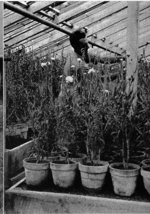
Oben: Jährlich werden hier etwa 12 000 Jungpflanzen unter freiem Himmel aufgezogen, wo sie sich an die herbe Bergluft gewöhnen. Links: Bereits ist es dem Nelkenzüchter Frontini gelungen, einen Pflanzenexport nach Norwegen und der Türkei anzubahnen. Wir zeigen ihn hier mit einem prachtvollen Strauss leuchtendroter Malmaison- oder Bündner Nelken