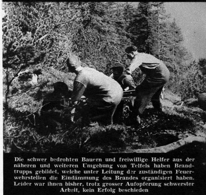
Die schwer bedrohten Bauern und freiwillige Helfer aus der näheren und weiteren Umgebung von Telfels haben Brandtrupps gebildet, welche unter Leitung der zuständigen Feuerwehrstellen die Eindämmung des Brandes organisiert haben. Leider war ihnen bisher, trotz grosser Aufopferung schwerster Arbeit, kein Erfolg beschieden