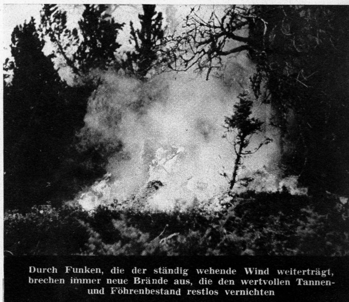
Durch Funken, die der ständig wehende Wind weiterträgt, brechen immer neue Brände aus, die den wertvollen Tannen- und Föhrenbestand restlos vernichten