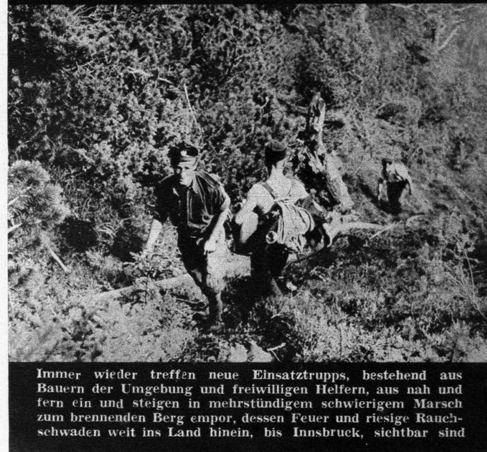
Immer wieder treffen neue Einsatztrupps, bestehend aus Bauern der Umgebung und freiwilligen Helfern, aus nah und fern ein und steigen in mehrstündigem schwierigem Marsch zum brennenden Berg empor, dessen Feuer und riesige Rauchschwaden weit ins Land hinein, bis Innsbruck, sichtbar sind