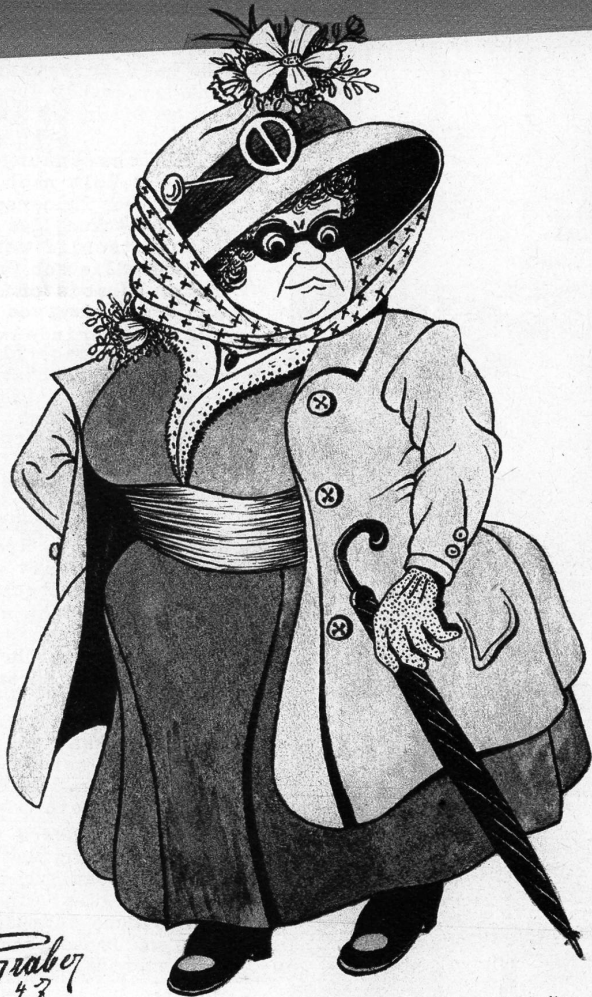
Die Präsidentin des Frauenbundes zur Bekämpfung der Modetorheiten