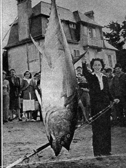
Einen guten Fang machte die Frau eines Fischers aus Lannan (Frankreich). Sie fing am 19. September diesen Thonfisch im Gewicht von 210 kg