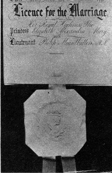
Am 20. November wird in der Londoner Westminster-Abtei die Hochzeit der englischen Thronfolgerin mit dem «Leutnant Philip Mountbatten» stattfinden. Dieser Tage ist im Dispensationsbüro des Erzbischofs von Canterbury, der die Trauung vollziehen wird, die königliche Lizenz unterzeichnet worden