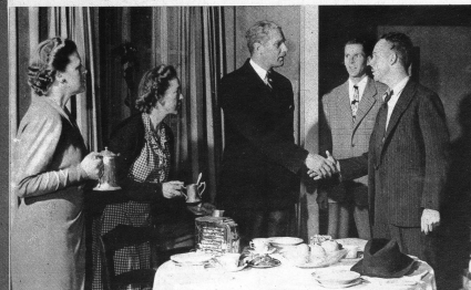
Der Direktor und der Gewerkschaftssekretär finden sich und beschliessen, zusammen das zu tun «was recht ist» und nicht mehr darum zu kämpfen «wer recht hat»