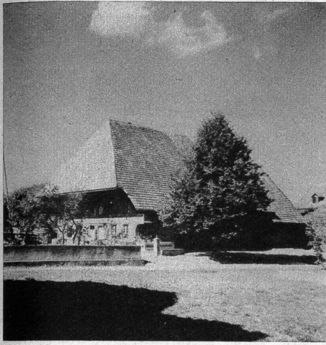
Währschafter Bauernhof in Jegenstorf

schaft ihren Sitz hat. Da stehen die Wagen der Bauern im Frühling, wenn es gilt, Saatgut und Dünger zu holen, und im Herbst, wenn die landwirtschaftlichen Produkte zum Verkauf kommen; da ist reger Verkehr im Lebensmittelgeschäft, so gut wie in ihren Filialen in Iffwil und Münchringen. Aehnlich arbeitet auch die Mostereigenossenschaft oberhalb des Dorfes für die ganze Gegend. Und mitten im Dorf steht die Käseerei, eine der grössten des ganzen Gebietes; nicht weit davon ist der Sitz der «Elektra Fraubrunnen», die das ganze Amt mit Strom der BKW versorgt, und das Gewerbe am Bach dient der Landwirtschaft im weiten Kreise. Im schönsten Sinne «dient» aber dem ganzen Amt das Spital, oben am Wald gegen Grafenried zu gelegen. Es ist 1912 errichtet und in den letzten Jahren neuzeitlich ausgebaut worden; und dort werden nun auch die regelmässigen Röntgenschleuchtungen der Tuberkulosefürsorgestelle durchgeführt. Aber auch auf geistigem Gebiet ist diese Zusammen-