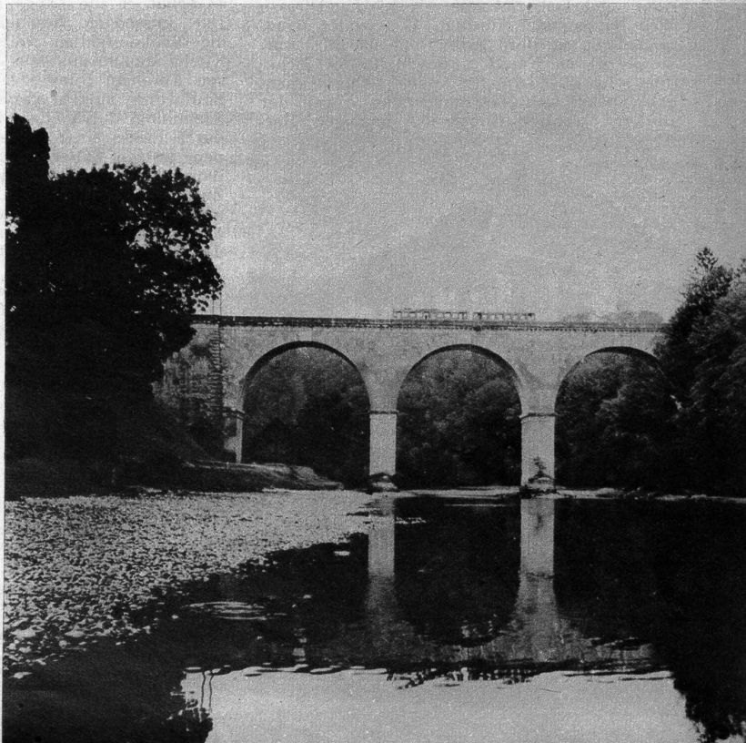
Über die Tiefenaubrücke fährt die Solothurn-Zollikofen-Bern-Bahn in die Gemeinde Bern ein