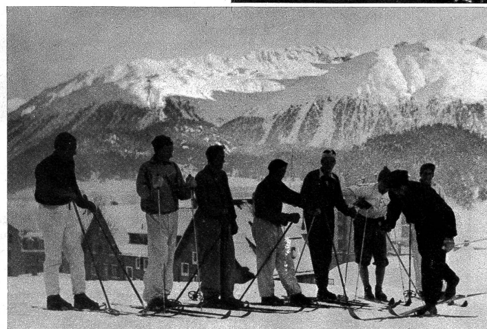
Zur Selektionierung der schweizerischen Mannschaft, die unser Land an den Olympischen Winterspielen vertreten soll, fanden sich alle prominenten Skifahrerinnen und -Fahrer zu einem mehrtägigen Trainingskurs in St. Moritz ein. Unter der Leitung bewährter Instrukturen absolvierten die Teamanwärter ein umfassendes Training. — Unser Bild zeigt den Altmeister im Langlauf, Adolf Freiburghaus, mit den Langläufern bei der Instruktion.