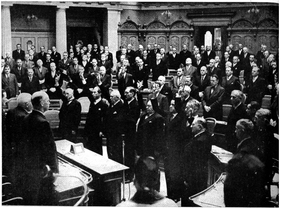
Oben: In der vergangenen Woche, am 11. Dezember, wurden von der Bundesversammlung die Bundesräte neu gewählt und vereidigt. Unser Bild zeigt die Bundesräte und den Bundeskanzler mit erhobener Hand bei Ablegung des Eides.